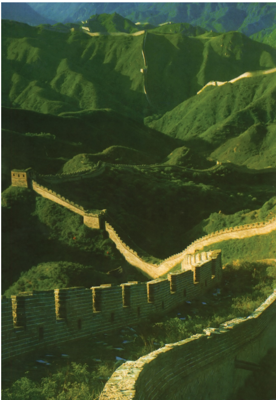
Marele Zid Chinezesc ( Wan li chang cheng ) – măreție și simbol.