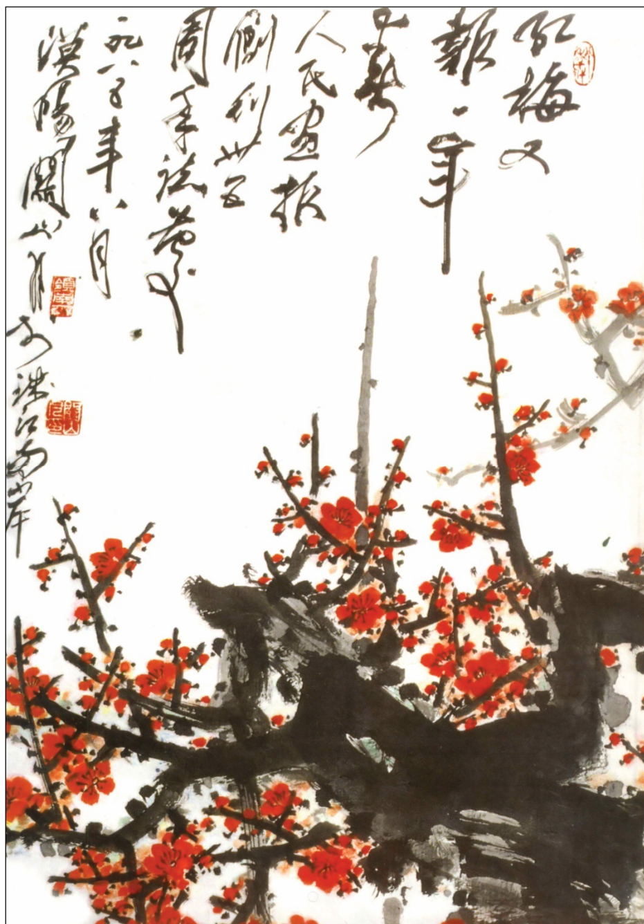
Guan Shanyue, „Vestitoarea primăverii” (detaliu) Mei hua – Floarea de prun pitic, simbolul cutezanței și al spiritului chinezesc eroic.