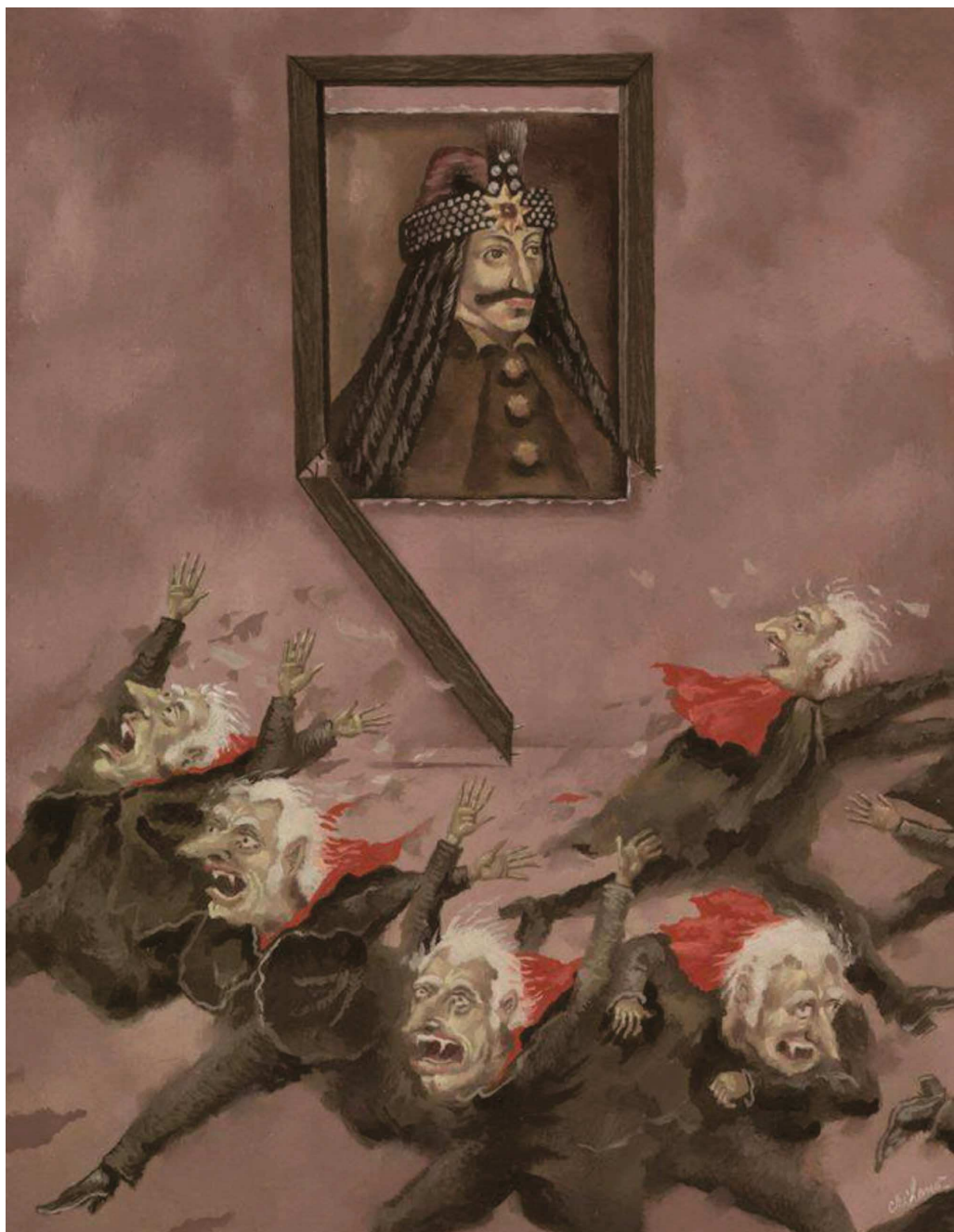
„Fuga”, 2019, Seria „Portrete”, autor: Florian Doru CRIHANĂ, Palatul de Justiție