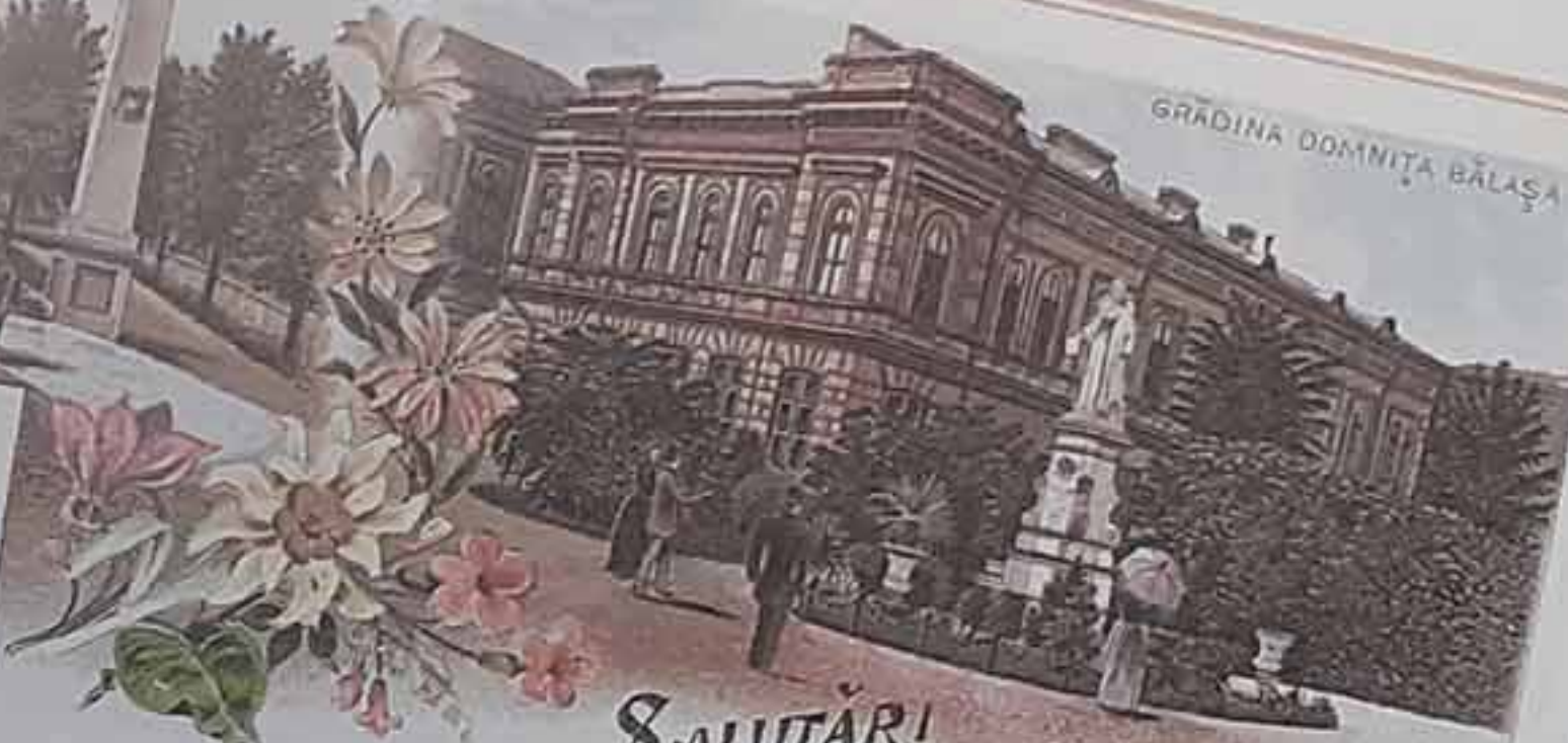
GRADINA DOMNIȚA BALAȘA