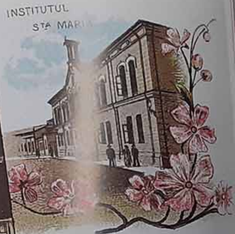
INSTITUTUL STA MARIA