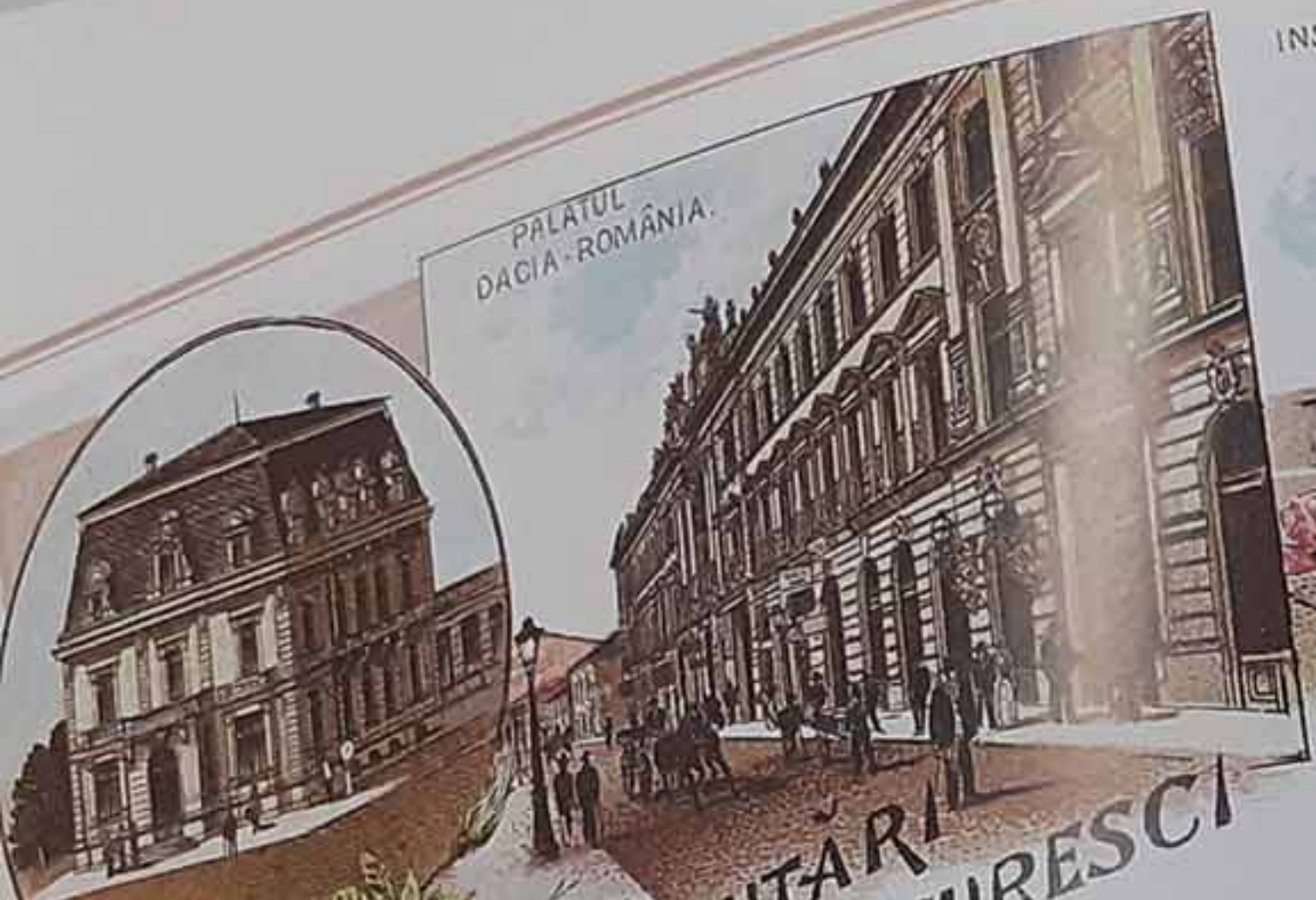
PALATUL DACIA - ROMANIA.