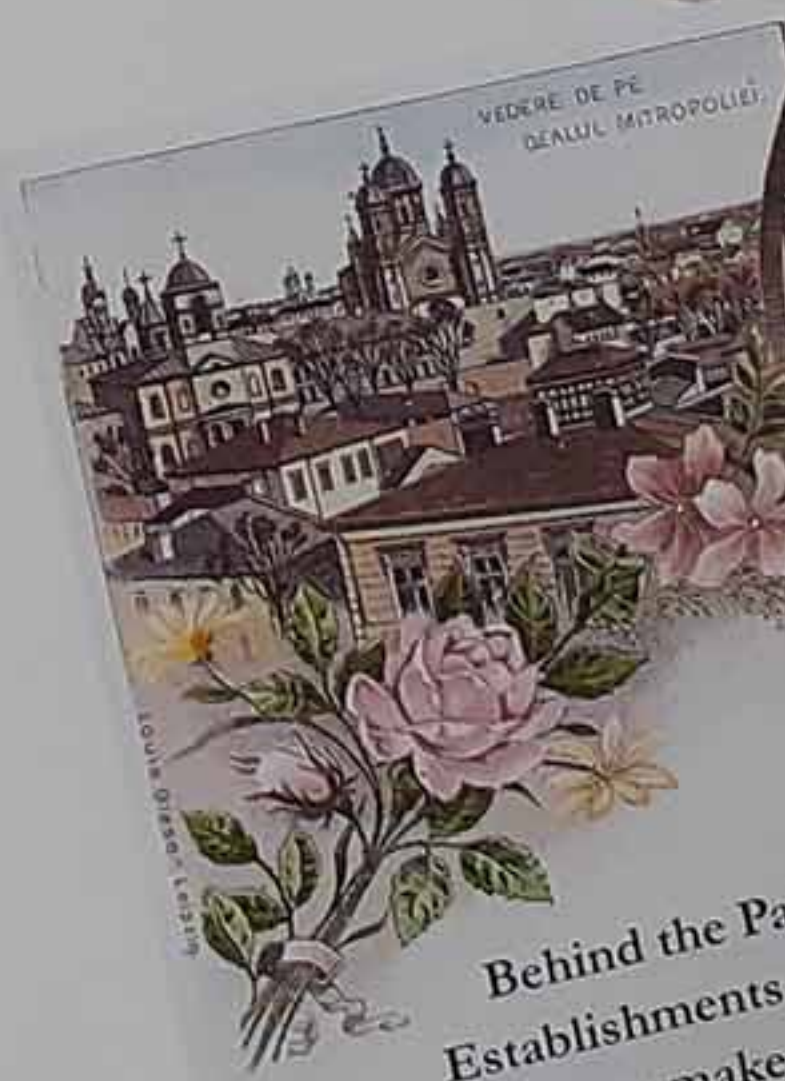
VEDERE DE PE DEALUL MITROPOLIEI.