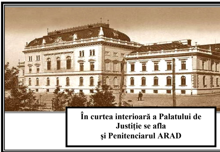
În curtea interioară a Palatului de Justiție se afla și Penitenciarul ARAD

Nu se cunosc primele atestări documentare referitoare la existența unui loc unde erau ținuți deținuții, însă în “Analele Regatului Ungariei” ale lui Pray Pal se consemnează că Gheorghe Doja cu cei 41 de căpitani ai săi au fost închiși în Bastionul nr. 1, sub denumirea de Bastion al Aradului. Istoricul cetății, în mai bine de 200 de ani de existență, este legat de diferite