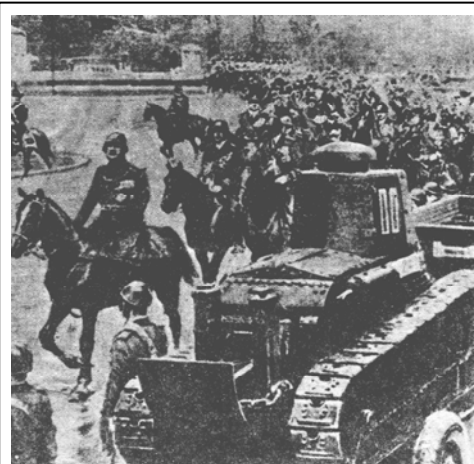
Paradă italiană la Roma

Aliații au sesizat acest fapt, iar Harry Hopkins, trimisul special al președintelui nord-american Franklin Delano Roosevelt a încercat să-l convingă pe Stalin să nu mai livreze petrol germanilor. Soarta războiului – i-a spus Hopkins lui Stalin – depinde de motoarele cu benzină. Țara care va dispune de cea mai mare producție de motorină va fi în cele din urmă învingătoare” 2 .